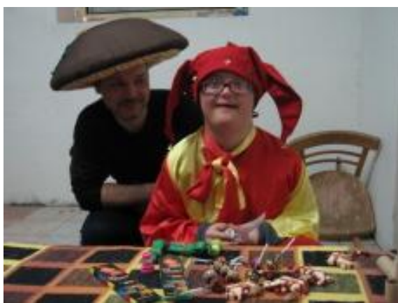
Zimní integrační tábor Boží Dar – karneval a poklad