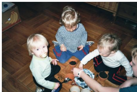
školička – děti pracují s různorodým materiálem