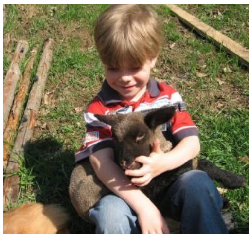
Koně ,králíci, ovečky a další zvířátka ve spojení s krásnou přírodou- to jsou Bučovice

Na podzim se podařilo i zrealizovat dvě relaxační odpoledne pro maminky dětí s handicapem. Maminky si mohly odpočinout při masážích, popovídat o starostech při kávě a čaji. Během masáží jim děti hlídala naše chůva. Relaxační odpoledne byla pro maminky zdarma a zařídila je pro nás Bohuslava Náměstková a 8 jejích kolegů – masérů. (Tito pro nás masírovali bez nároku na honorář.)