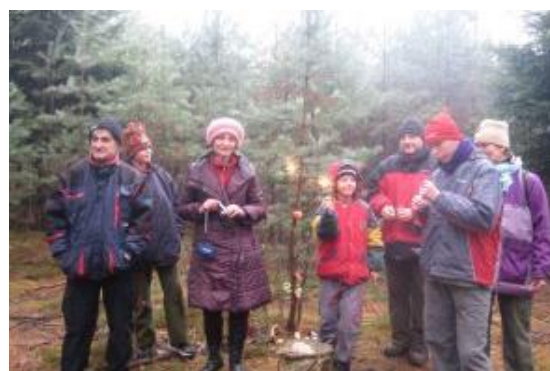
Nadílka pro zvířátka – klánovický les – prosinec 2009