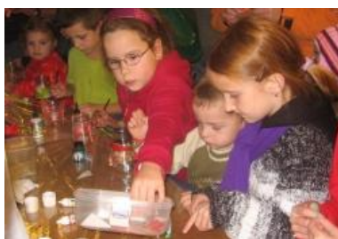
Svatý Martin – Praha 14