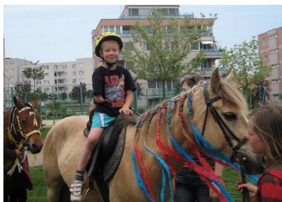
Čarodějnice a První máj – Praha 14