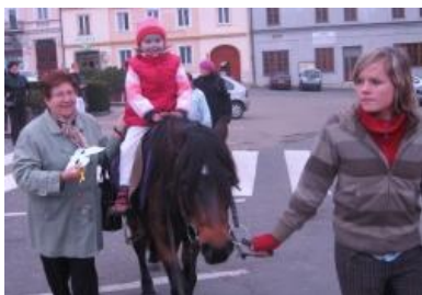
Svatý Martin – Votice