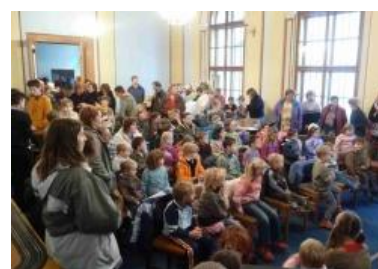
Svatý Martin – Kouřim