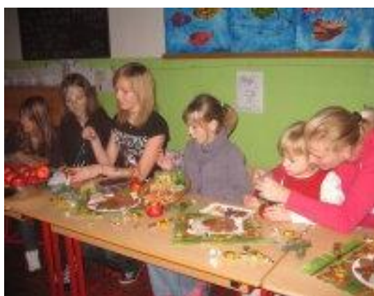
Mikulášská nadílka – prosinec 2009