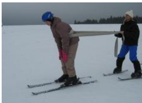
Lyžují! I přes svůj vážný handicap. Zimní tábor Boží Dar