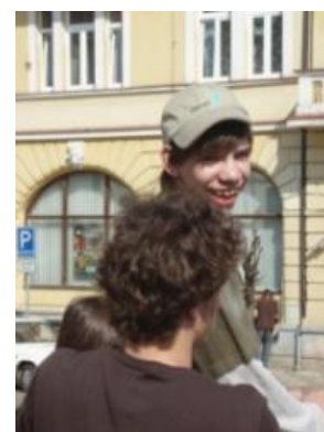
Velikonoce ve Voticích 2009 – jedna z již tradičních akcí, která probíhá v rámci programu „Nech to koňovi“