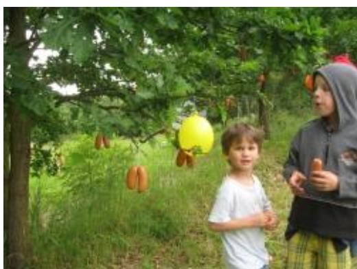
Den KPZ – květen 2009 – Dařbuján a Pandrhola

KPZ má i své vlastní stránky aktualit: Zajíčkoviny http://www.zajiceknakoni.cz/cs/zajickoviny