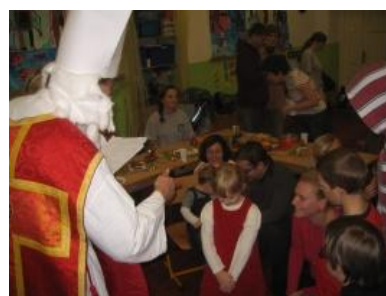
V roce 2009 nemohla chybět již tradiční Mikulášská nadílka. Letos byla spojená i s dílničkou.