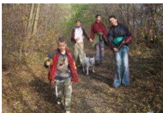
Výšlap po okolí klubovny - listopad 2009