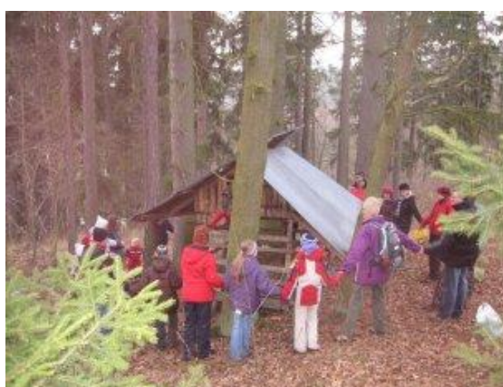
Vánoce u koní – Bučovice – prosinec 2009