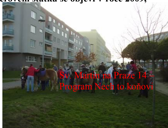
Sv. Martin na Praze 14 – Program Nech to koňovi

– budujeme u Votic u Benešova. Více o bezbariérovém statku se objeví v roce 2009, neboť je to zcela nový projekt.